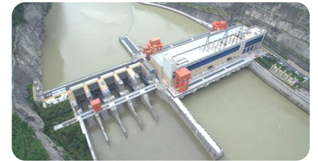
大渡河枕沙水电站