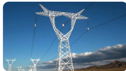
农村电网改造工程

完成各项工程的保供任务并且全面保障四川能投集团 31 个县级供电区域超百亿元电网建设工程物资供应，拥有全国超 1200 家供应服务商，供应金额超 70 亿元。