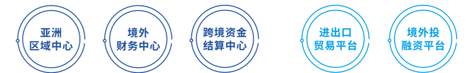
三个中心两个平台

围绕以三个中心两个平台的战略定位，积极主动地融入服务国家“一带一路”，加快布局以南亚、东南亚为重点的海外市场，以能投香港作为四川能投集团“走出去”的国际化重要实施平台，全力拓展海外业务、拓宽投融资渠道，扩大经营规模，推进海外贸易、投融资、资本运作一体化发展。